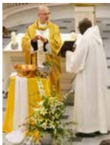
Bénédictio de l'eau.