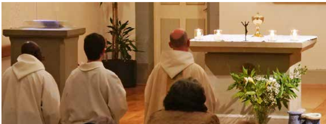
Adoration du Saint Sacrement pendant une demi-heure.