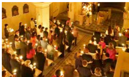
Bénédiction du feu, du cierge pascal avec ses clous – Chacun avec son cierge allumé.