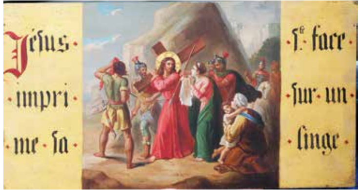
Les quatorze stations du chemin de croix ont été restaurées.

... dans l'atelier Héritier SCR/SKR Les Acacias/Genève