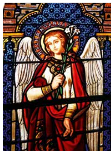
L'archange Gabriel porte un lys blanc.