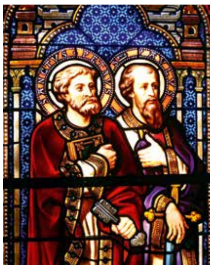
Saint Pierre tient les Evangiles et ses clés et saint Paul son épée.