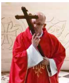
M. le curé vénère la croix présentée à l'assemblée.

C'est le seul jour de l'année où il n'y a pas de messe dans le monde entier. Dans son homélie, M. le curé « compare » les souffrances de Jésus, à celles du « peuple » de Paris qui a pleuré la destruction de la cathédrale Notre-Dame, et où le Christ a triomphé par la non-destruction de l'autel et de la croix qui continue de briller au milieu des cendres et autres gravats.