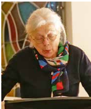
Soliste Geneviève Fradique.