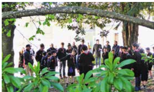
Meute Saint-Dominique, promesse.