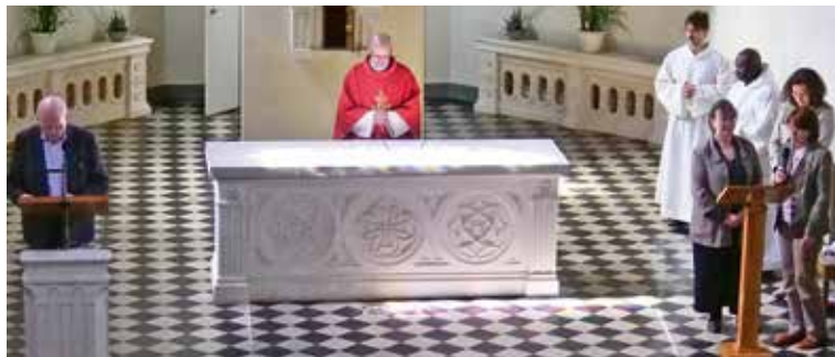
Lecture de la Passion à quatre voix.