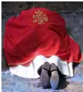
M. le curé face contre terre.