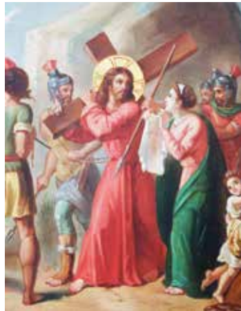
Jésus imprime sa sainte face sur un linge.