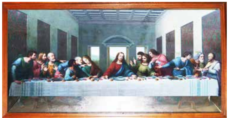
La Sainte Cène.