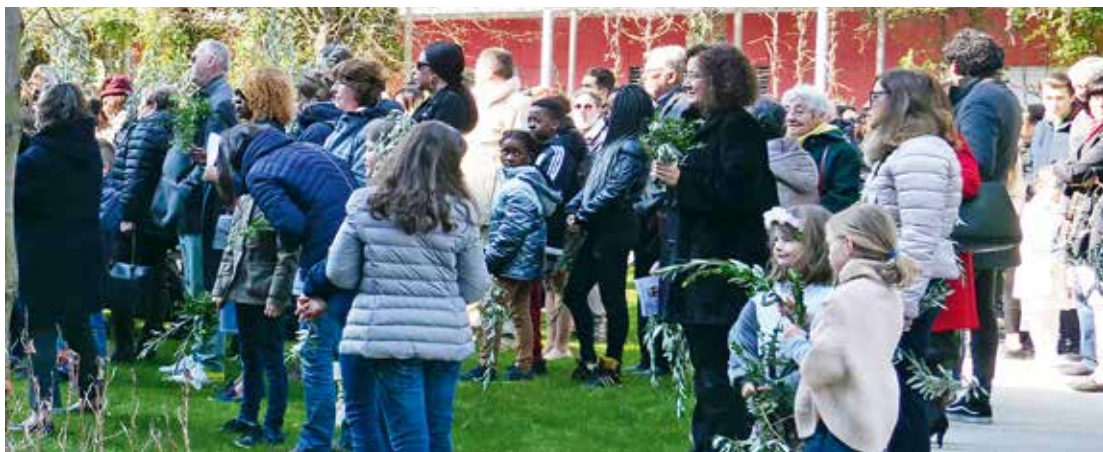
Rassemblement devant l'EMS Saint-Loup – Bénédiction des rameaux.