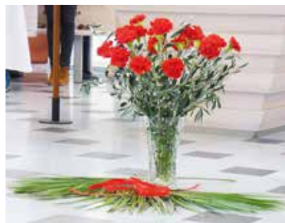
Décoration florale Rameaux 2019.