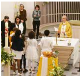
Les enfants acceptent le baptême .