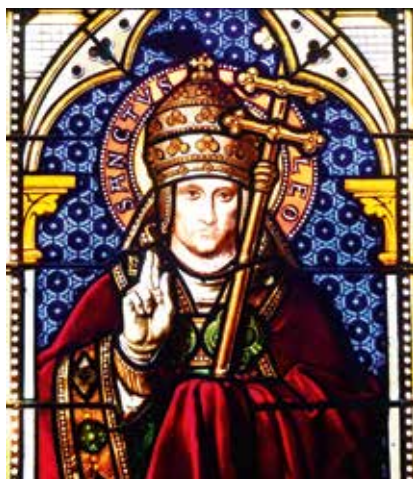
Saint Léon, pape avec sa tiare pontificale.