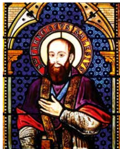
Saint François de Sales, évêque de Genève.