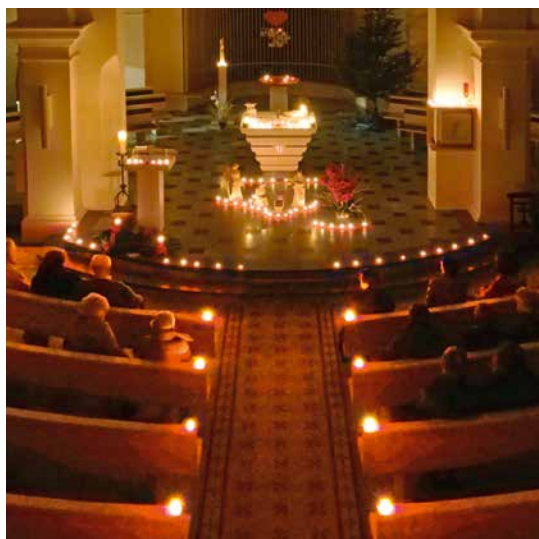
100 lumignons pour l'illumination de l'église.