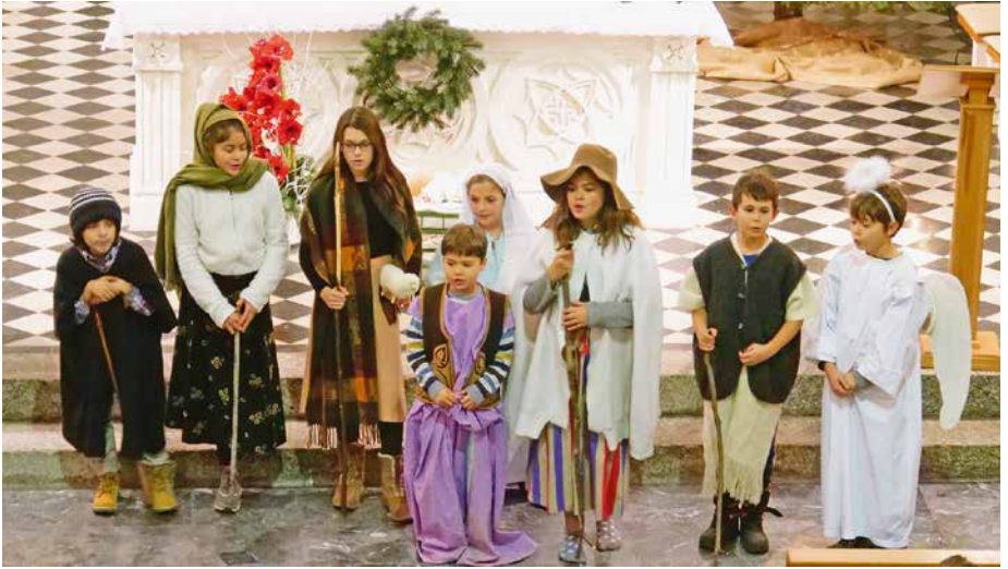
Les enfants de Collex-Bossy ont préparé et joué un jeu de crèche.