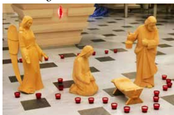
Attente de la venue du Christ!