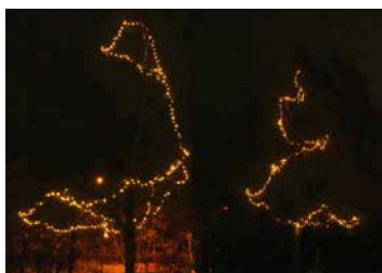
Devant l'église les tilleuls sont illuminés.