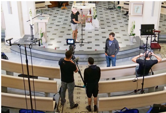
Briefing de coordination images-son avec deux caméras.