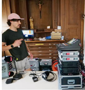
Régie son – liaison 4G.