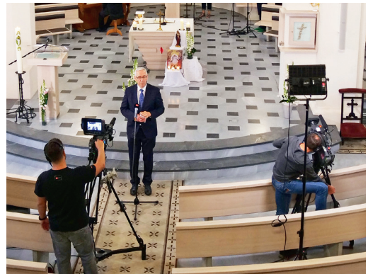
Présentateur son Radio et TV.

La transmission des images et du son de télévision a été faite par une liaison satellite, alors que pour le son radio, la transmission a emprunté les canaux du réseau NATEL 4G de Swisscom et, en cas de difficultés ou de problèmes techniques, une liaison « téléphonique » temporaire.