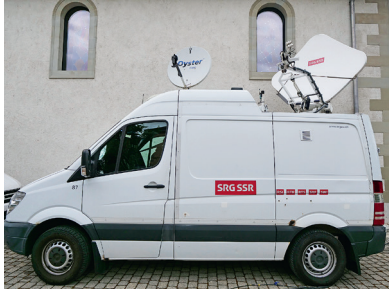
Car TV avec antennes satellites.

messe du dimanche 11 mai a également été diffusée sur la chaîne YouTube-UPjura. La production comprenait cinq personnes: réalisateur, ingénieur son, technicien, caméraman, responsable de production. Ils étaient accompagnés d'un commentateur de RTS Religion de cath.ch .