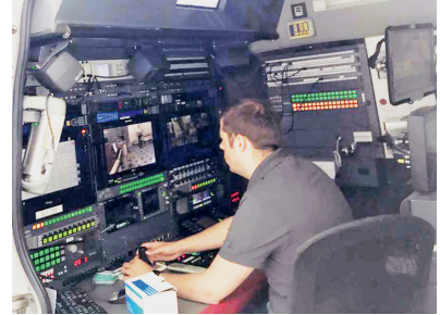
Régie image dans le car TV.