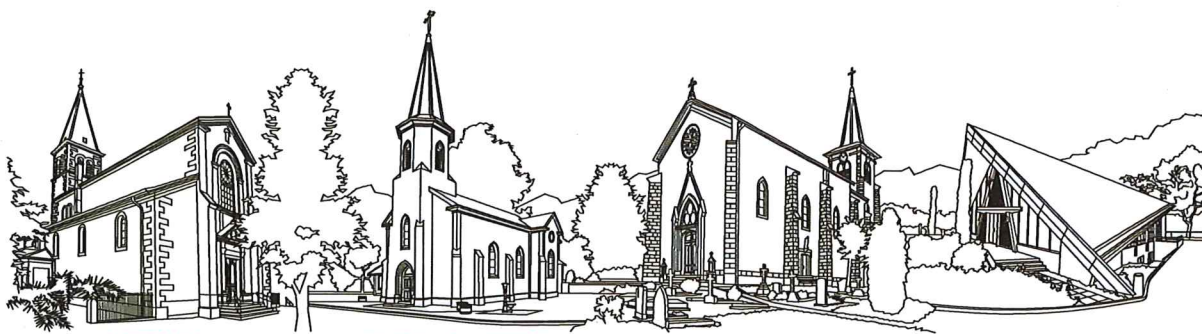
VERSOIX Eglise Saint Loup