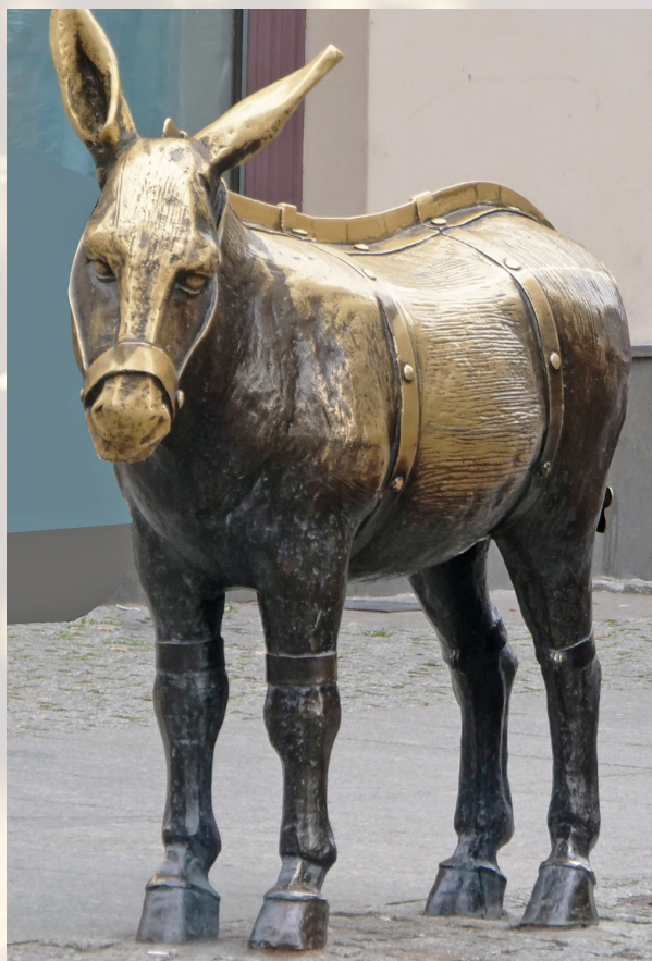
Ane statufié à Torun.

Là, dans un coin retiré, sous une voûte de feuillage, un bébé gigotait, couché sur de la paille, entouré de ses parents. Des anges jouaient divers instruments et un bœuf couché soufflait sur l'enfant pour le réchauffer. Une grande étoile filtrait ses rayons à travers les branchages et illuminait ce