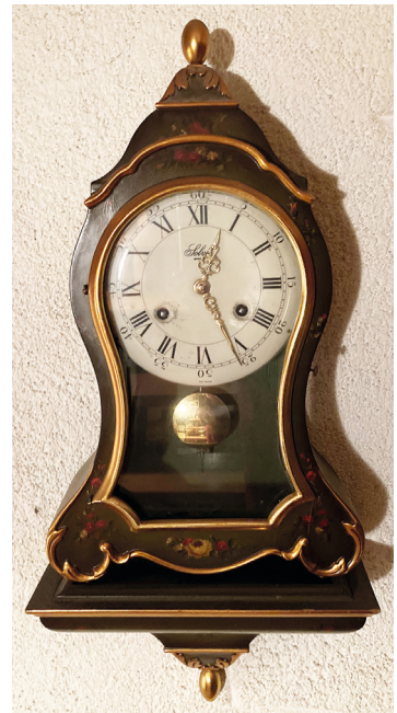
L'horloge indique le temps qui passe.

Nous avons grandi, nous avons toute notre vie pour grandir. Nous sommes devenus des adultes, nous avons fait des choix, nous en ferons encore parce que la vie nous permet d'évoluer à tout instant.