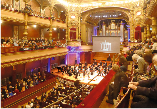
L'Orchestre de Chambre de Genève au Victoria Hall.