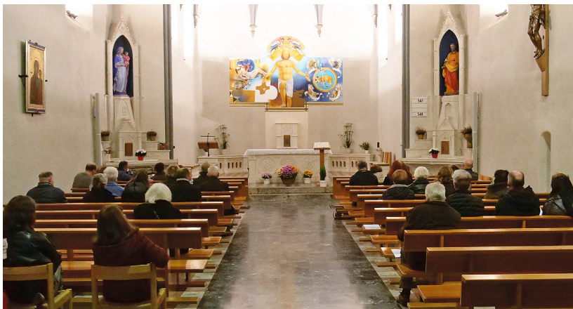
Dans l'église de Collex, à l'écoute du concert

PAR GENEVIÈVE FRADIQUE-GARDAZ