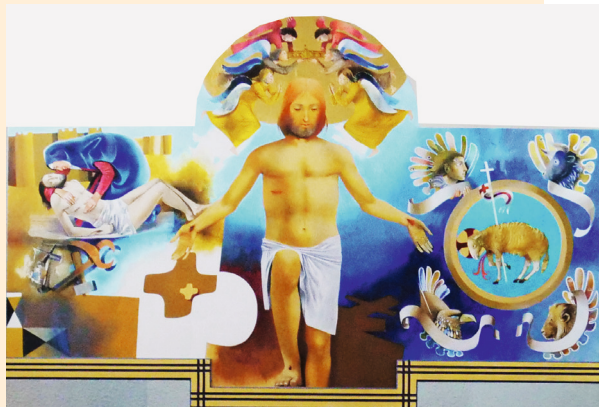
Le Retable d'Arcabas à l'église de Collex.