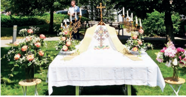
Le reposoir devant l'EMS.