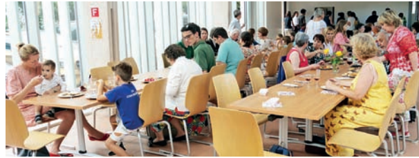
Repas canadien à la salle paroissiale de Versoix.