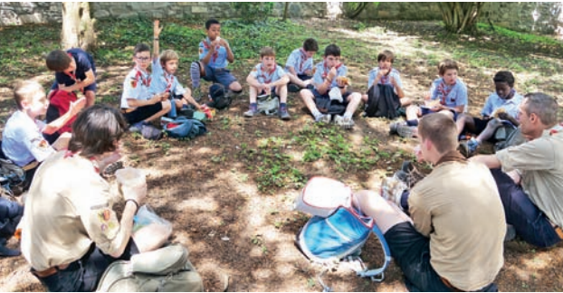
Les scouts de la meute Saint-Dominique de Genève.