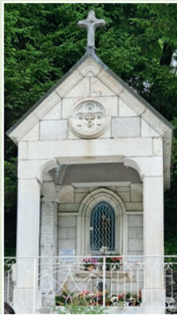
Le Sanctuaire de la Vierge Marie fondé par Saint François de Sales.