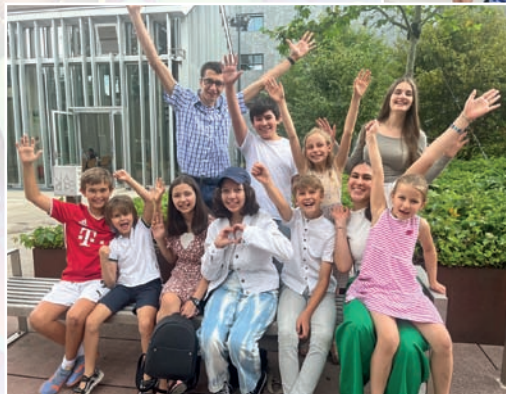
Voilà une jolie photo d'une partie des enfants présents aux réjouissances de ce dimanche et qui nous donnent Espérance pour l'avenir de notre Eglise! (CB)