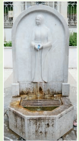
La fontaine de la guérison.