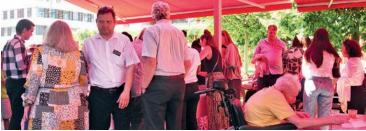
Apéritif convivial offert devant l'EMS Saint-Loup.