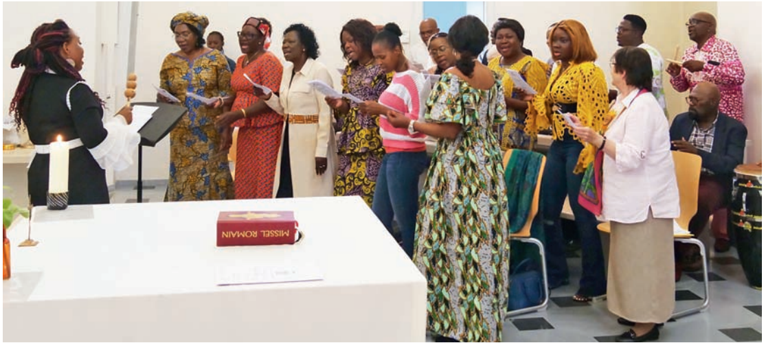
Chorales africaine et de l'UP, dimanche 2 juillet 2023 à Versoix.