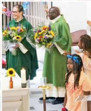
Nos deux anniversaires avec des fleurs.