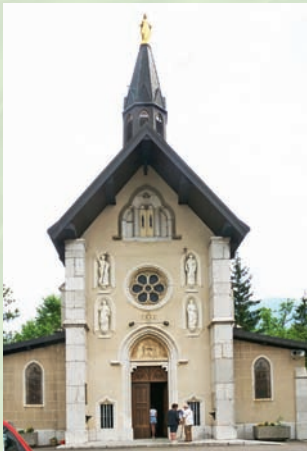
La chapelle du Sanctuaire.