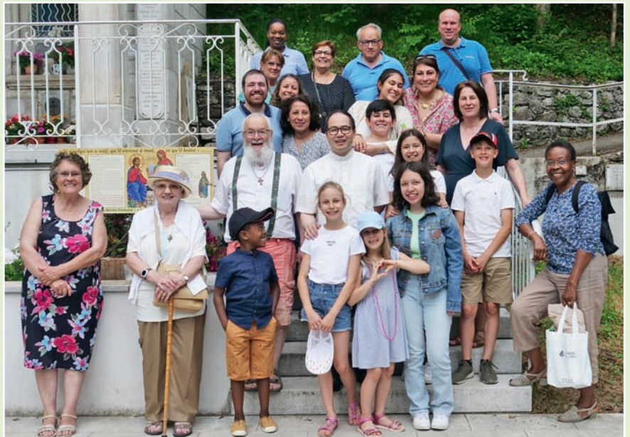
Les pèlerins 2023 de l'UP Jura à Bénite Fontaine.