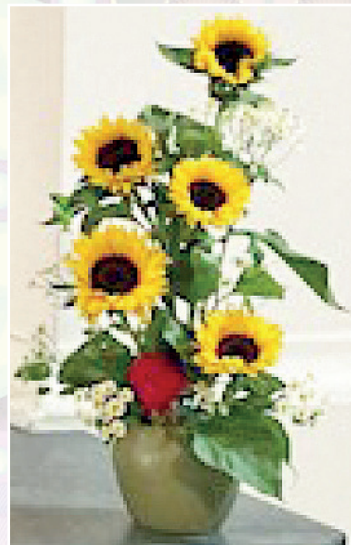
Des tournesols pour faire la fête et pour célébrer l'été qui vient d'arriver.